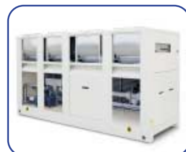
Rückkühler mit Radialventilatoren Mod. RH 016.6/VC