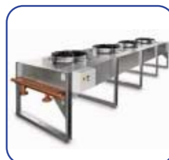
Rückkühler mit Axialventilatoren Mod. HFC 200.V