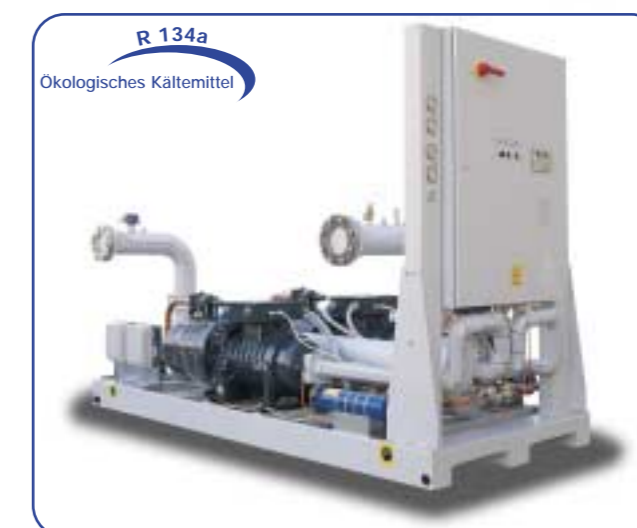
Flüssigkeitskühler mit externem Verflüssiger