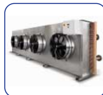
Rückkühler Mod. HFC 200.S