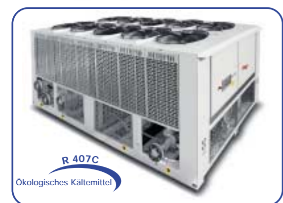
Flüssigkeitskühler in sehr leiser Version mit doppeltem Hydraulikkreislauf und Wärmepumpe Ausführung

Die HITEMA Entwicklungs- und Forschungsabteilung hat eine Reihe von Produkten entwickelt, die den hohen Industrieprozess-Standards entsprechen. Die Zuverlässigkeit und die Effektivität von luft- und wassergekühlten Flüssigkeitskühlern werden durch thermische und akustische Tests, in ihren Leistungsdaten, nach internationaler EURO-VENT Zertifizierung überprüft. Dank der entwickelten Instrumente und der Software aus der HITEMA Entwicklungs- und Forschungsabteilung können mit Hilfe von Z-PC- Module, Fließmengen, Drucke, Temperaturen und elektrischen Daten ausgearbeitet werden. Das PC und Software System Z-DATA RECORDER nehmen die Daten auf und visualisieren die aufgenommenen Werte. Nach Vollständigkeit der Prozesstests wird ein Excel-File zum weiteren Gebrauch hergestellt.