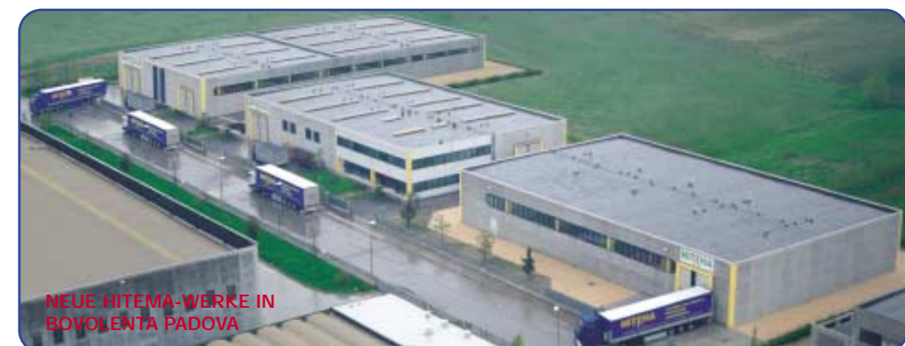
NEUE HITEMA-WERKE IN ROVOLENTA PADOVA

DATEN BEZOGEN AUF: Wasser/Glykol 30 % Lufttemperatur 35 °C Mediumentrittstemperatur 45 °C Mediustrittstemperatur 45 °C * Schalldruckangabe in 10m Entfernung auf der Wärmetauscherseite unter Freifeldbedingungen Der Inhalt der Daten ist nicht verbindlich, die Firma behält sich das Recht vor, jederzeit die Angaben zu ändern V = Vertikaler Luftstrom HFC... = VENTILATOR DREIECKSCHALTUNG H = Horizontaler Luftstrom HFC...S = VENTILATOR STERNSCHALTUNG Ventilatoren: HA 80.6 3,5/1,9 A 2,2/1,2 KW