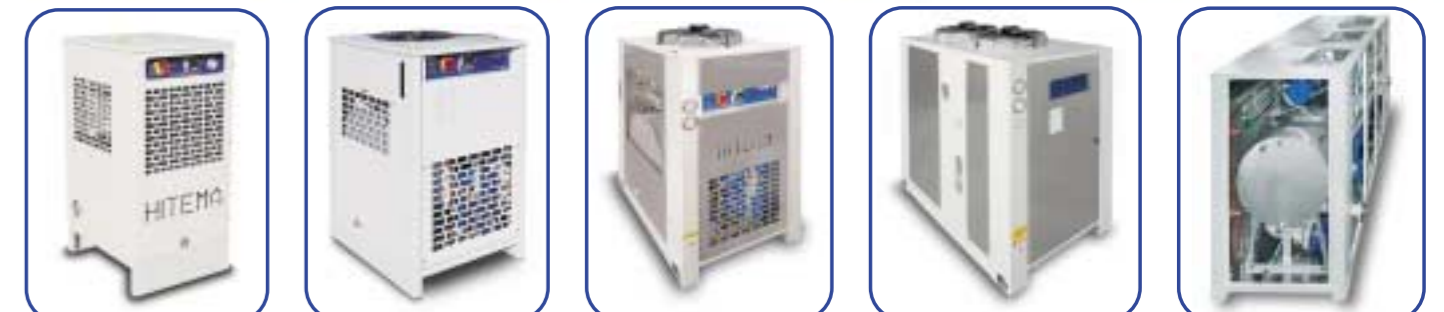
Flüssigkeitskühler Mod. ECA.003