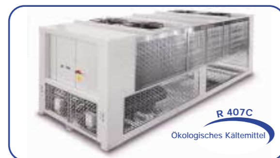
Flüssigkeitskühler mit integriertem free-cooling Mod. ECF.310

Für die Entwicklung der eigenen Produkte, benutzt HITEMA cad. Solid Edge 14. Dies ermöglicht eine gewisse Flexibilität bei Projektsenderungen und eine hohe Qualität der Ästhetik. Die Insight.net-Technologie ermöglicht dem gesamten Unternehmen eine Verbesserung in der Qualität und der Entwicklung, dank eines kompletten Visualisierungssatzes Web, basierend auf net Technology von Microsoft. Diese Lösung beschleunigt den Zugang zu den Produktinformationen in kürzester Zeit. Zudem ist Solid Edge in der Lage, mittels fortschrittlicher Werkzeuge für die D2 Dokumentation, eine Serie von Optionen zu verknüpfen, die wichtig sind bei der Übertragung von 2D- auf 3D-Daten. Die Version 14 ermöglicht außerdem umfangreiche Zeichnungsprozesse für die Plattenstanztechnologie zu automatisieren. Solid Edge besitzt dabei die Fähigkeit, auf vorhandene Vorlagen zur technologischen Fortentwicklung zurück zu greifen und diese weiterzuentwickeln. Dem zur Folge entfallen sämtliche Vorplanungsarbeiten und unnötige handschriftliche Listen, welches zu einem erheblichen Zeitgewinn führt.