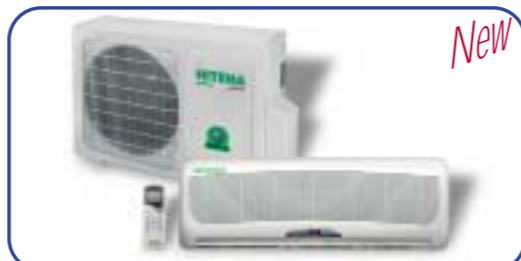
HITEMA Klimageräte ideal für alle Bedürfnisse