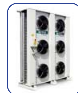
Rückkühler Mod. RH 008.6